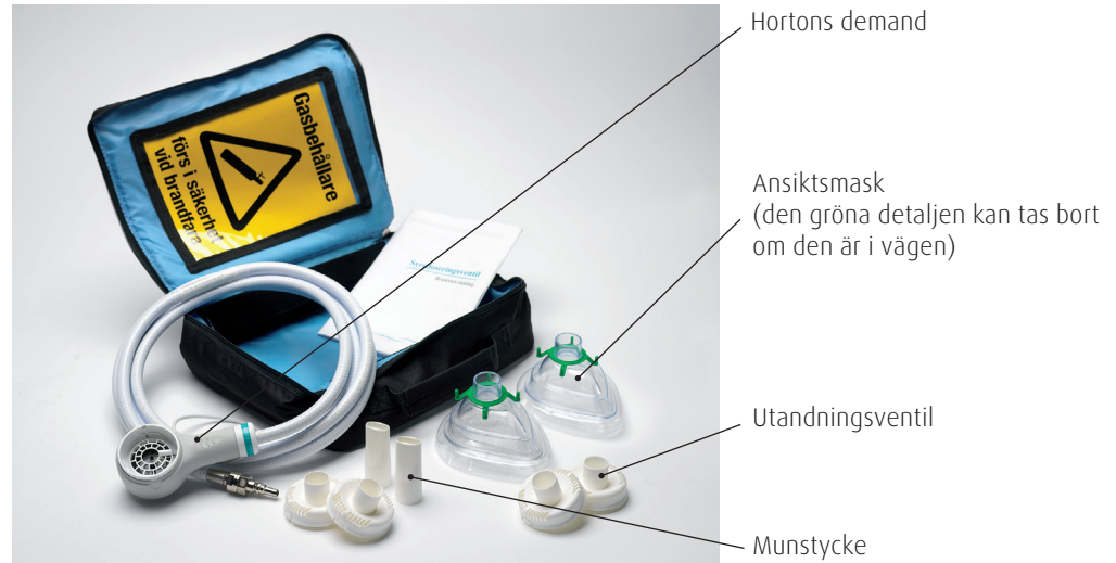
Hortons demand startpaket.

Hortons demand startpaket innehåller de tillbehör du behöver för att ta din syrgasbehandling vid Hortons huvudvärk från en syrgasflaska med så kallad snabbkoppling. Hortons demand levereras i en väska med Hortons demand gassparare, 2 st ansiktsmasker, 2 st munstycken, 4 st utandningsventiler, bruksanvisning och varningstriangel.